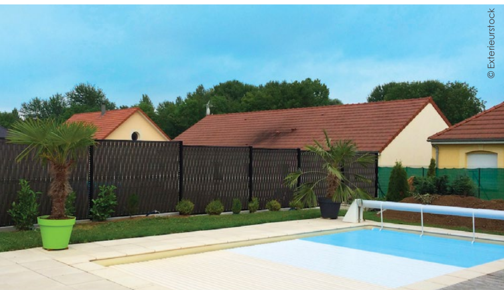
Les kits d'occultation proposés par la société Exterieurstock ne se décolorent pas, ne craignent donc pas les UV, ni le gel, la grêle, et surtout, elles ne nécessitent aucun entretien.

d'occultation qui lui sont adaptés. Ce nouveau panneau possède des mailles de 100 x 200 mm, avec donc des lattes occultantes de 100 mm, ce qui donne encore plus d'occultation et un effet très contemporain par rapport aux panneaux classiques de maille 45 mm ou 50 mm du marché" précise-t-il.