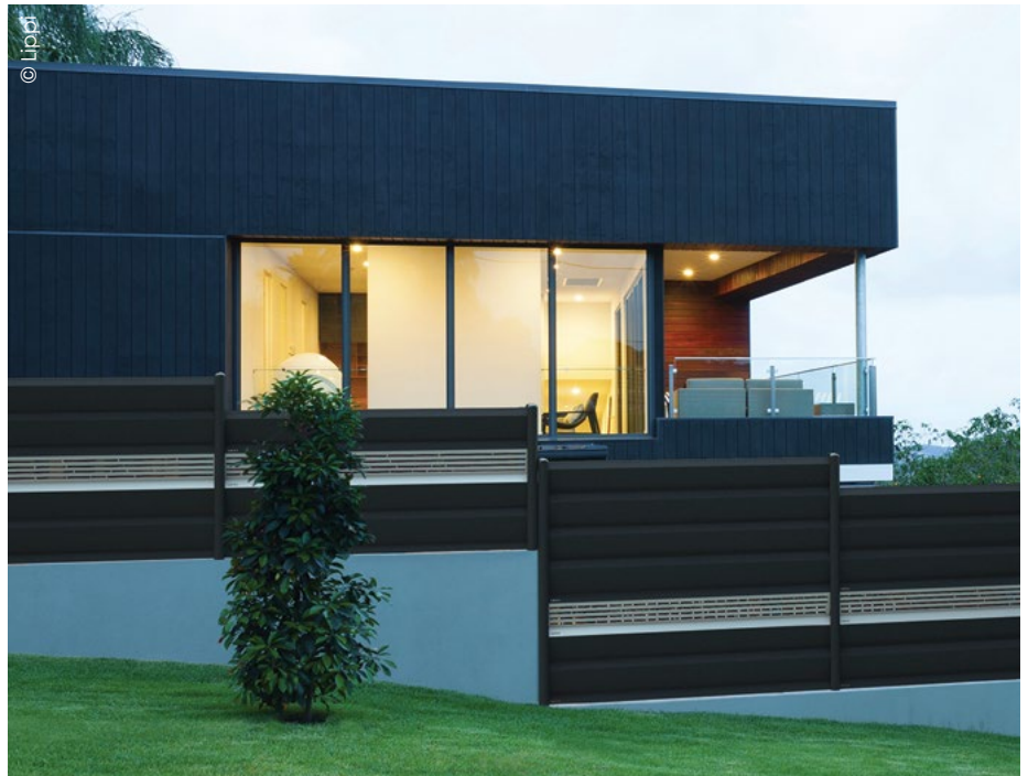
La solution d'occultation 'Z' de Lippi est modulable. Des lames ajourées de motifs peuvent être remplacées par des lames dites pleines, obstruant des perspectives que le client ne souhaite plus.

des kits d'occultation que des claustras, des clôtures rigides ou des panneaux. "Désireux de conserver notre avance dans le domaine de la clôture avec occultation composite, nous avons lancé en ce début d'année deux nouveaux produits : le panneau 3MX (clôture rigide de 3 m en fil de 6 mm), et donc les kits